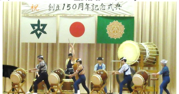
武蔵流東松山太鼓さんによる演奏