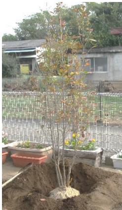
記念植樹「シャラの木」

12月11日(月)から17日(日) まるっと! (9:00~ 12:00~ 17:00~ 21:00~)