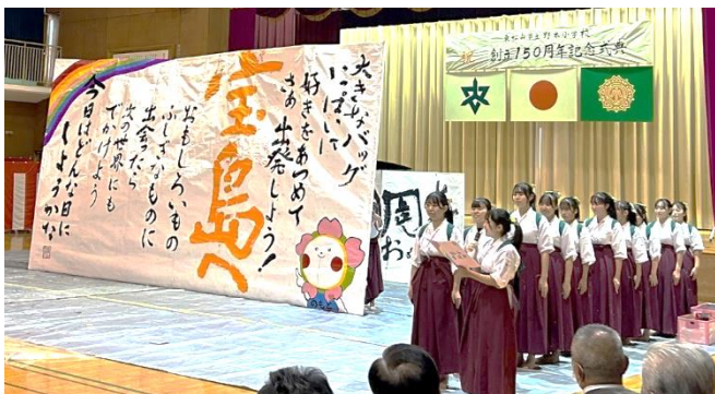
松山女子高等学校書道部さんによる書道パフォーマンス