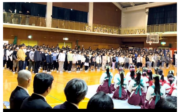
全校合唱「ビリーブ」